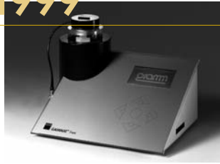
1999: GAMMAT® free