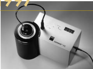
1997: GAMMAT® 11C