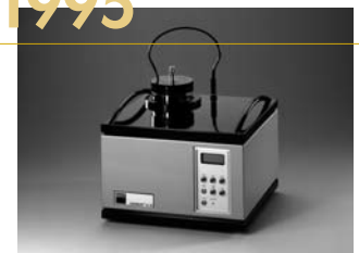
1995: GAMMAT® 21M