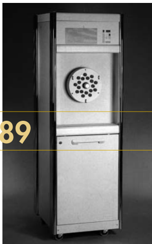
1989: GAMMAT® 12

Technologisch einen großen Schritt nach vorne bedeutete das GAMMAT® 21M von 1995. Erstmals wurde ein optionales Galvano-Vergoldungssystem angeboten, welches Hartvergoldungen und die Herstellung von Friktionserneuerungen von getragenen Teleskoparbeiten ermöglichte.