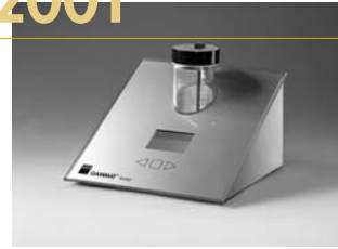
2001: GAMMAT® easy