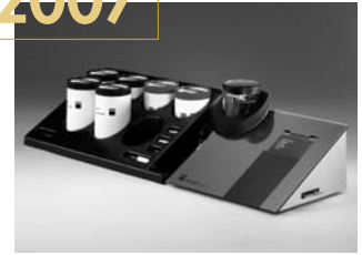
2007: GAMMAT® optimo+AU-SET