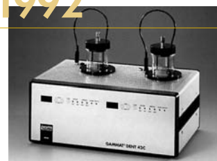
1992: GAMMAT® DENT 42C